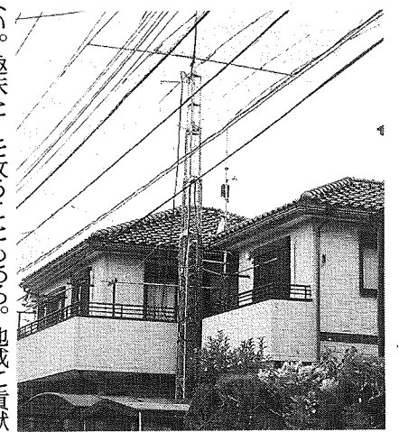
アマチュア無線のアンテナがある住宅

1級から4級まであり、4級なら小学生でも取得可能である。資格を取らずに無線機を使用すると電波法違反となり1年以下の懲役または100万円以下の罰金が科せられる。最近では携帯電話の普及によりアマチュア無線の局数が減り、136万を超えていた局数が今は60万局を下回る。ところで、アマチュア無線には電波障害の懸念がある。例えば、テレビ